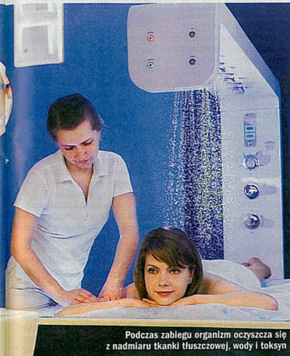
Podczas zabiegu organizm oczyszcza się z nadmiaru tkanki tłuszczowej, wody i toksyn

logiczny płuc. Diagnostykę dopełniają: USG jamy brzusznej, ze szczególnym naciskiem na stan wątroby i dróg żółciowych. Mając w rękę pakiet badań, lekarz prowadzący podejmuje decyzję, które z palety proponowanych podczas terapii zabie-