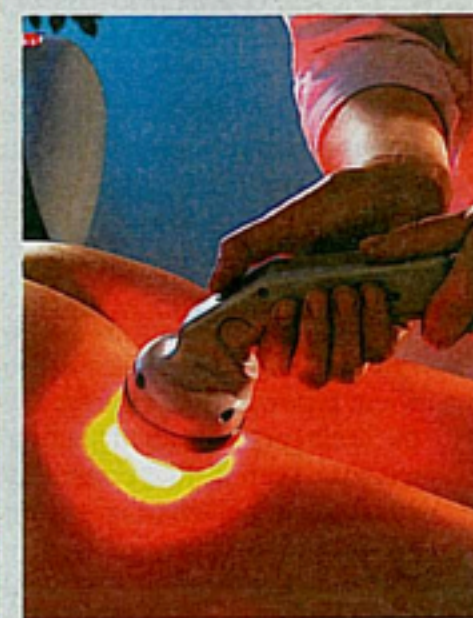
Zabiegi ujędrniają skórę zwiótczałą po odchudzaniu i korygują sylwetkę

Rodzaj masażu limfatycznego z użyciem pola elektromagnetycznego, fal radiowych, podciśnienia, lasera i podczerwieni, pobudzający tkankę skórą i podskórą. Ten bezinwazyjny i bezbolesny sposób zagęszczenia, uelastycznienia i ujędrnienia skóry, wyszczupla i koryguje sylwetkę. Likwiduje rozstępy i zapobiega efektowi zwiótczałej i obwisłej skóry podczas odchudzania. Zabiegi redukują pierwsze, drugie i trzecie stadium cellulitu oraz powstrzymują rozwój tej choroby w czwartym stadium. Zależnie od wskazań zaleca się 5-10 zabiegów.