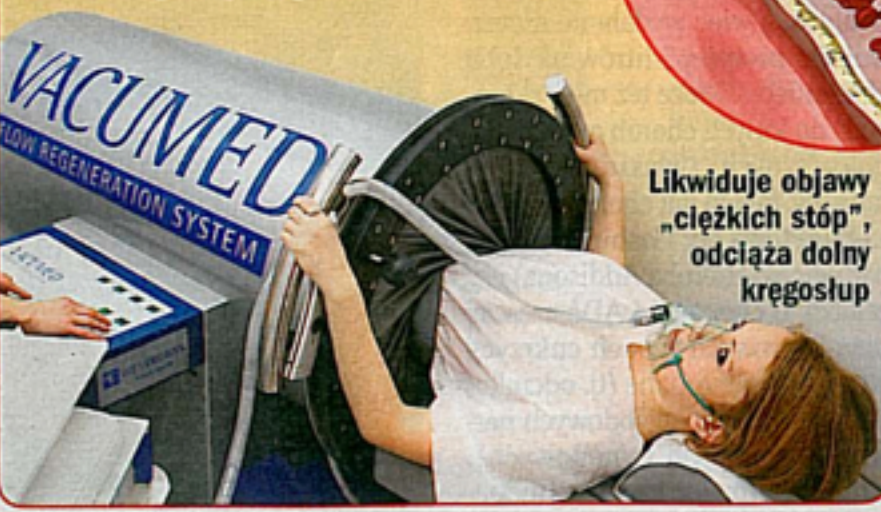
Likwiduje objawy „ciężkich stóp”, odciąża dolny kręgosłup